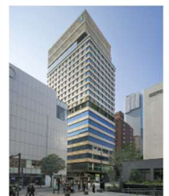
福岡市中央区天神2丁目8番49号 ヒューリックスクエア福岡天神 4F・5F